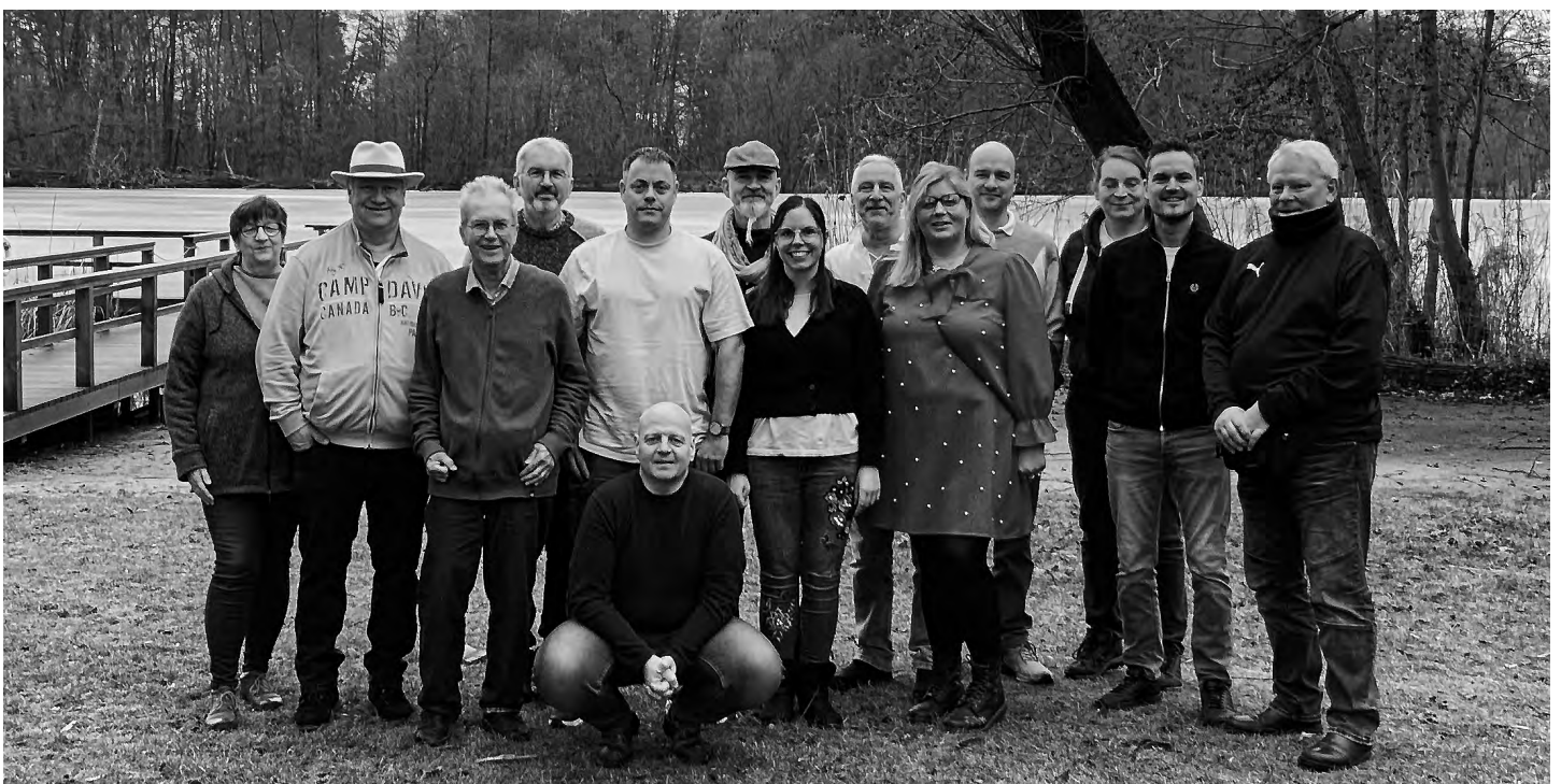
Klausurtagung der GVV am 12./13.02.2026 in Werder

Um im Wettbewerb mit der Privatwirtschaft zu bestehen, braucht es transparente und leistungsorientierte Vergütungssysteme. Neben der Grundbesoldung bzw. tariflichen Eingruppierung können Leistungsprämien, Fachkräftezulagen, Gewinnungszulagen oder Entwicklungsstufen gezielt eingesetzt werden. Ebenso wichtig sind nicht-monetäre Anreize wie Karriereperspektiven, Fortbildungsangebote, flexible Arbeitsbedingungen und eine wertschätzende Führungskultur. Nur ein Gesamtpaket aus fairer Bezahlung und attraktiven Arbeitsbedingungen sichert langfristig Fachkräfte im öffentlichen Dienst.