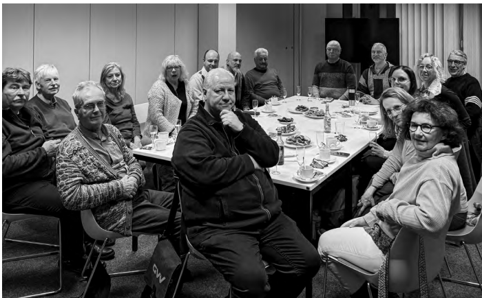
Neujahrsempfang GVV am 07.01.2026. Grundsatzgespräch mit einigen Aktiven in der Landesgeschäftsstelle der Debeka